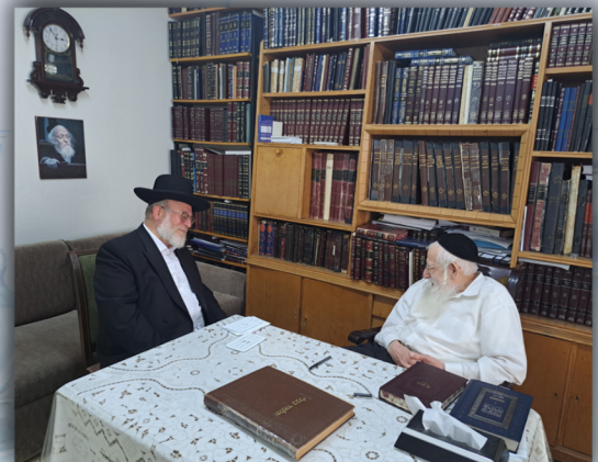
ביקור להגאון הגדול ר' עזריאל אויערבך שליט"א לקבל ברכה