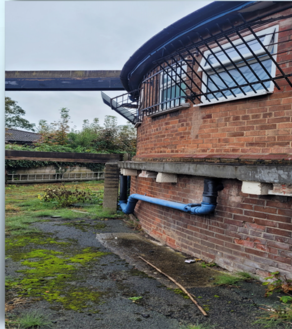
Mai Geshomim channel