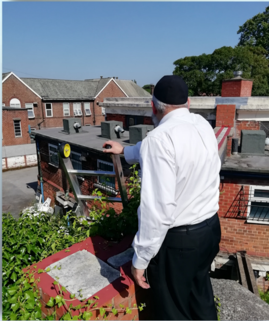
Inspecting the Boir Mai Geshomim