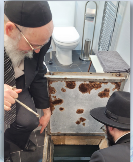
Inspections by the Vaad Hakashrus of the Mikva