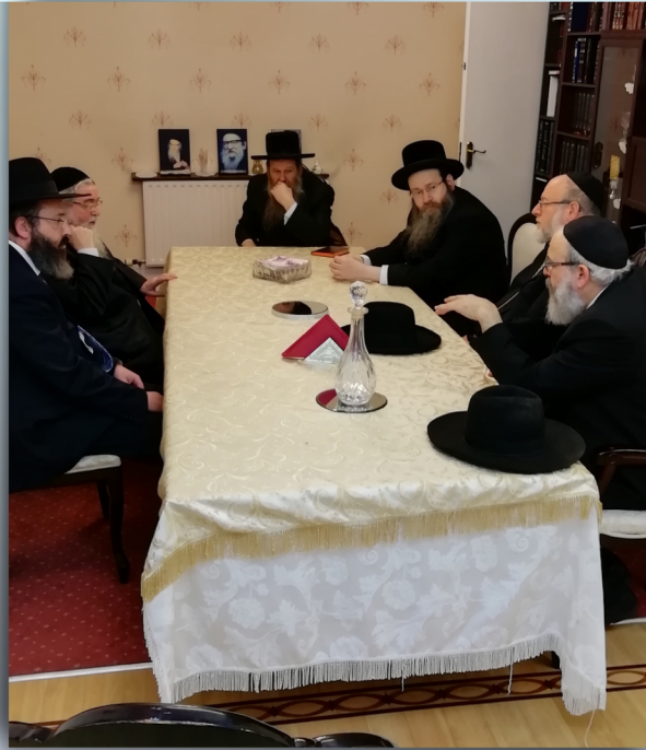
בביתו של הרב הגאון דיין א' י' וועסטהיים ז"ל