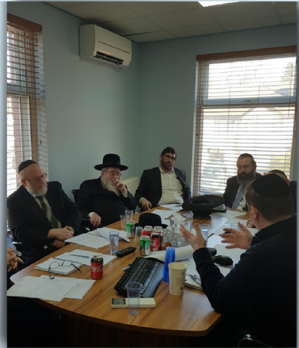
הצוות עוסקים בעניני שיפוצי המקווה